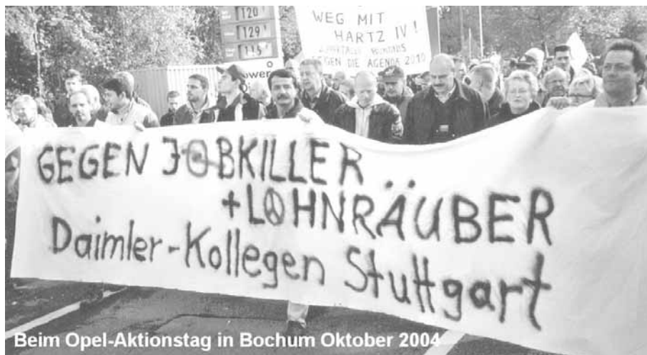
Beim Opel-Aktionstag in Bochum Oktober 2004