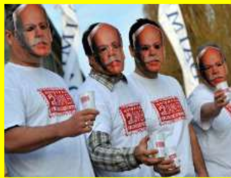
Daimler-Aktionärsversammlung 2009: alternative – Protest gegen Lohnkürzung