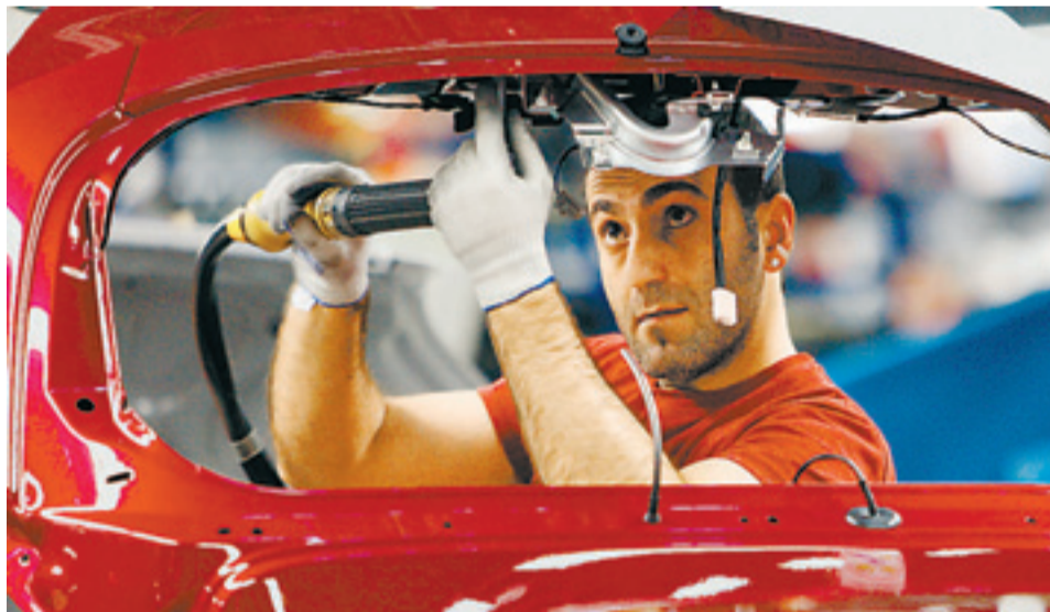
Bei Daimler (Bild oben) werden viele Zeitarbeiter nach den Ferien nicht mehr zurückkommen. Ford (unten) hat 200 Zeitarbeiter abgemeldet. Sie wurden in der Zwischenzeit entlassen.