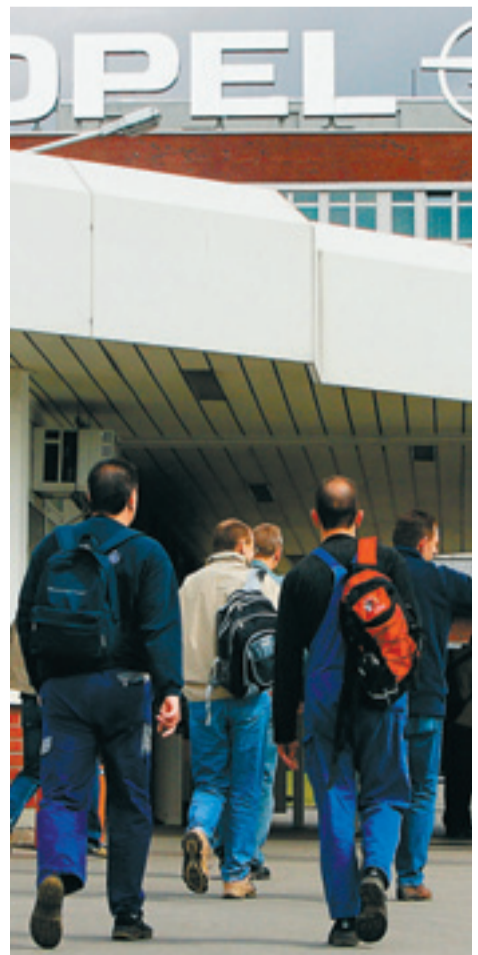
Opel schickt Zeitarbeiter nach Hause, um die Stammebelegschaft halten zu können.

Die Zeitarbeitsbranche, die in den vergangenen Jahren so sehr zulegte wie keine andere in Deutschland, steht vor schweren Zeiten. Es vergeht kaum ein Tag, an dem Unternehmen nicht mitteilen, dass sie ihre Leiharbeiter nicht mehr brauchen. Ferdinand Dudenhöffer, Automobilexperte der Universität Essen/Duisburg, rechnet sogar damit, dass bei Autoherstellern und Zulieferern im Zuge der Finanzkrise 100 000 Leiharbeiter abgemeldet werden. Für diese Menschen bedeutet das aber nicht automatisch die Kündigung. Die Zeitarbeitsfirmen, bei denen sie angestellt sind, müssen zunächst nach einem neuen Einsatzort suchen. „Die Firmen werden Himmel und Hölle in Bewegung setzen, um die Leute unterzukriegen“, glaubt Ludger Hinsen, Hauptgeschäftsführer des Branchenverbands BZA. „Schließlich verdienen sie damit ihr Geld.“ Ob das in Zukunft allerdings noch klappt, ist mehr als fraglich.